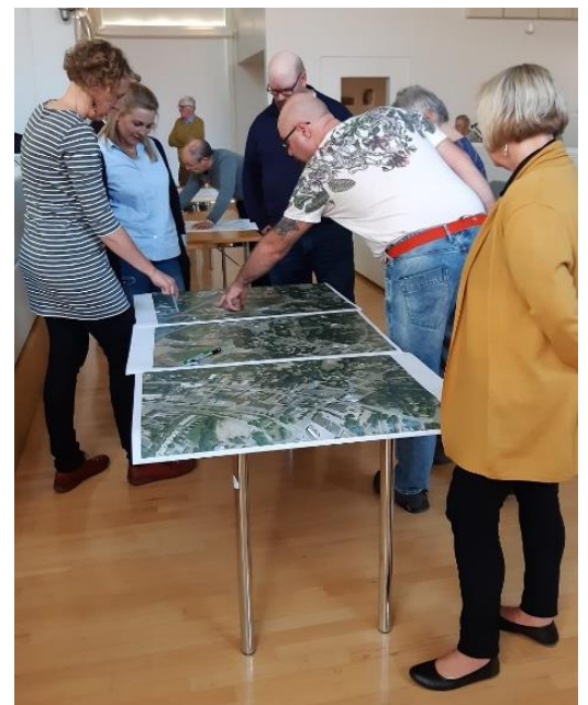
Osallistamiskeinot ovat monien hankkeiden edistämisessä tärkeitä. Esimerkiksi avoimilla työpajoilla voidaan helposti osallistaa kuntalaisia ja sidosryhmiä.

Kunnan asukkaalla, kunnassa toimivalla yhteisöllä ja säätiöllä sekä sillä, joka omistaa tai hallitsee kiinteää omaisuutta kunnassa, on oikeus tehdä aloitteita kunnan toimintaa koskevissa asioissa. Näin todetaan kuntalaisissa ja aloiteoikeus on ollut olemassa vuodesta 1976 asti. Siitä huolimatta aloitteet ovat edelleen vähän käytetty vaikuttamisen muoto kunnassa kautta maan, myös Laitilassa. Laitilan kaupunki on päättänyt vuonna 2024 ottaa käyttöön sähköisen kuntalaisaloite.fi -palvelun, jonka