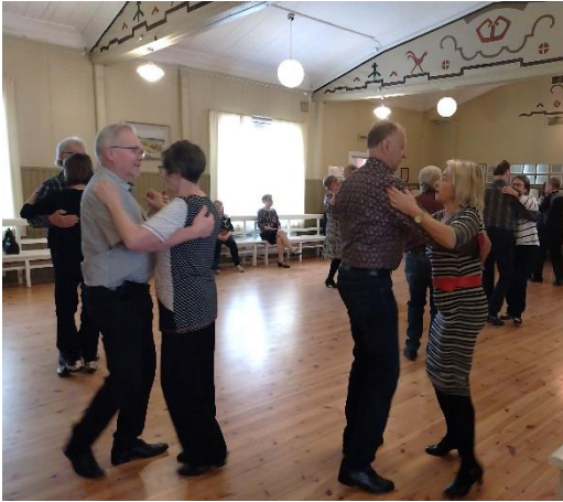
Sujuuko osallistamistyö kuin tanssi? Monesti tärkein palaute saadaan työarjessa ja palvelujen parissa. Esimerkiksi pitämällä korvat auki kuntalaistapahtumien yhteydessä.

Tärkeää kaupunkina on viestiä selkeästi asiakaspalveluajoista ja -paikoista sekä yhteydenottotavoista. Laitilan kokoisessa kaupungissa asiakaspalvelun jatkuva virka-aikaista saavutettavuutta kaikkien toimintojen osalta ei voida taata. Palvelun kriittisyys silti määrittelee myös saavutettavuutta: esimerkiksi vesihuollon päivystys pyritään järjestämään aukottomasti. Saavutettavissa pitäisi joka tapauksessa olla tieto siitä, mihin aikoihin palvelua saa ja minkä kanavien kautta. Nykyisellään