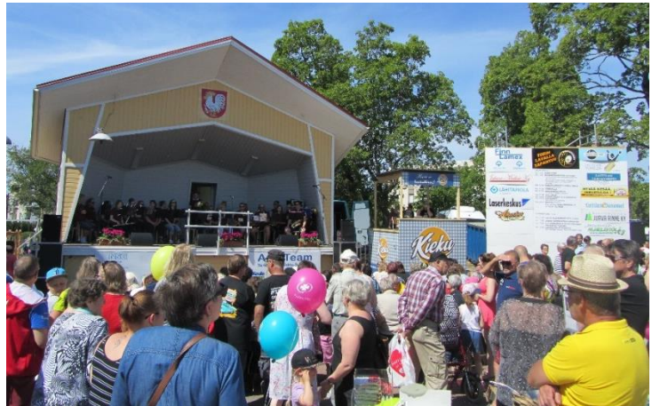
Suurin vuotuinen tapahtuma Laitilassa on Munamarkkinat, joka toimii paikallisen yhdistyksen voimin. Kaupungin ja yhdistyksen välinen yhteistyö toimintaedellytysten luomiseksi markkinatapahtumalle on silti äärimmäisen tärkeä.

Hyvän yhteistyön edellytyksiä on rakenteellisesti luotu siten, että vaikuttamistoimielimissä ja työryhmissä on yhdistysten edustajia. Myös kaupunginhallituksen nimeämiä kaupungin edustajia on mukana yhdistysten (vuosi)kokouksissa. Tiedonkulkua kaupungin ja yhdistysten välillä on näin pyritty edistämään ja antamaan vaikuttamismahdollisuuksia. Myös mahdollisuuksia toimeenpano-osallisuudelle on luotu ja otettu yhdistyksiä mukaan konkreettiseen tekemiseen. Esimerkiksi ukrainaispakolaisten tullessa kaupunkiin vuonna 2022, SPR:n paikallisyhdistys oli kaupungin apuna käytännön tehtävissä pakolaisten vastaanottamisessa.