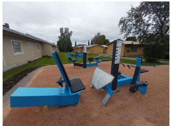
Osallistavan budjetoinnin määrärahalla Laitilassa on toteutettu esimerkiksi ulkokuntosali, jonka laitteet valittiin erityisesti ikäihmisten liikunnallisuutta tukemaan.

Vuonna 2022 Laitilassa aloitettiin osallistavan budjetoinnin prosessi. Kaupunki siis varasi määrärahan, jonka käytöstä kuntalaiset saivat vaikuttaa suoraan. Ensimmäisenä vuonna budjettiin oli varattu 50 000 euroa määrärahaa ja sittemmin summa on ollut 30 000 euroa. Prosessi on edennyt niin, että ehdotuksia budjetin käytöstä on kerätty ainakin sähköisesti (myös esimerkiksi kuntalaisillan yhteydessä niitä on kerätty) ja valmisteluvaiheen jälkeen organisaatiossa työstetyt ehdotukset on tuotu äänestykseen. Äänestys on tapahtunut sähköisen kyselylomakkeen kautta. Ehdotusten antamista on suunnattu eri teemojen kautta (esim. ikäihmisten hyvinvoinnin edistäminen). Ehdotuksia ja äänestysvaiheessa ääniä on annettu runsaasti ja toteutukseen on päätynyt kuntalaisten toivomia asioita. Määrärahan suuruus osaltaan ohjaa ehdotuksia ja lopullisia toteutuksia, mutta osallistavan budjetoinnin kautta on saatu toteutettua kuntalaisten arjen kannalta ”pieniä suuria asioita”.