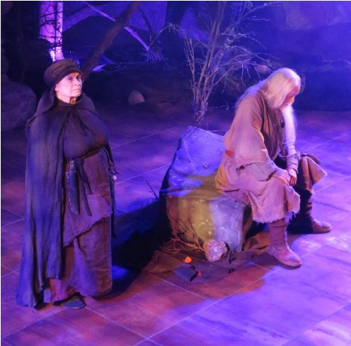
Sivistysvaliokunta on myöntänyt toiminnantukea muun muassa Laitilan Kulttuurin Tuki ry:lle kansanperinteeseen pohjautuvien produktioiden tuottamiseksi.

katsoa säännölliseksi, vähintään kerran kahdessa viikossa järjestettäväksi harrastustoiminnaksi Laitilassa. Perusavustuksen tarkoitus on tukea yhdistyksen toiminnan perusedellytyksiä. Kohdeavustusta voi hakea kulttuuri-, liikunta- ja nuorisotalon uuteen toimintaan, joita voi olla esimerkiksi projekti, tilaisuus tai hankinta, jonka voidaan katsoa lisäävän ja monipuolistavan toimintaa Laitilassa. Lisäksi liikuntatoimen kohdeavustusta voidaan myöntää laitilalaiselle yhdistykselle erityisliikunnan järjestämisen tukemiseen. Kulttuuriavustuksen avustusperusteita ovat