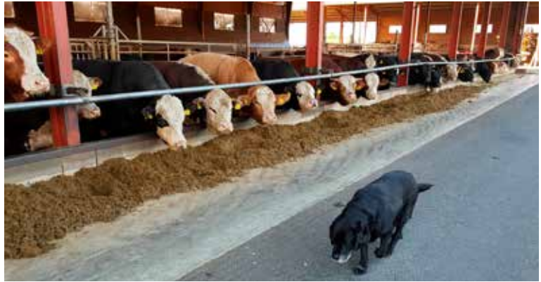
Mullimäen tilalla on isoja pihattonavettoja, joissa kasvatetaan hereford-, aberdeen angus, charolais-, limousin-, simmental- ja blonde d'Aquitane -rotuisia urosnauvoja.

– Haastavaa oli myös muutama vuosi sitten, kun olemme ainoa karjatiila kylällämme. Osa kyläläisistä häiriintyi traktoreiden ja rek-