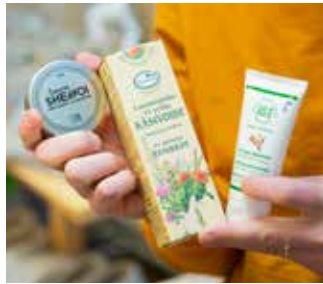
Knuutila uskoo, että hänen asiakkailleen tuotteiden kotimaisuus on tärkeää.

Verkko- ja kivijalkakaupan yhteensovittaminen toimii erittäin hyvin.