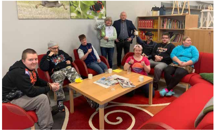
Vuoden työyksiköksi 2019 valittiin Palke 7.