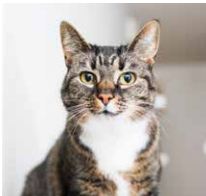
Dolly-kissakin viihtyy Laitilassa.

Riitta Perkkolan mukana Laitilaan muutti myös hänelle rakas perintölipasto. Se kokoaa yhteen tärkeimpiä valokuvia ja esineitä.